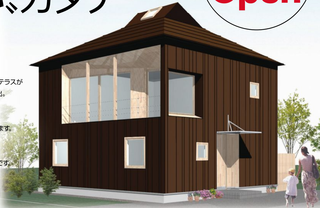
外観パースはイメージです。